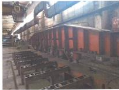
Raboteza (taiere placi):