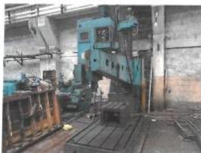
Masina roloit tabla: