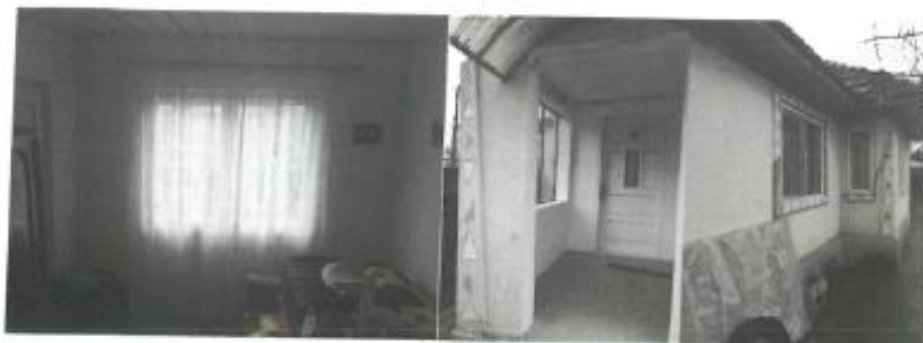
C2 - extindere C1