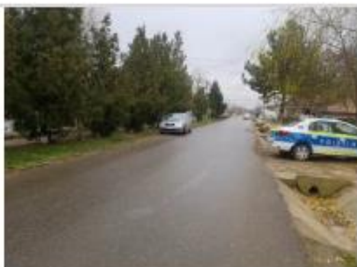
Str. General Dragalina