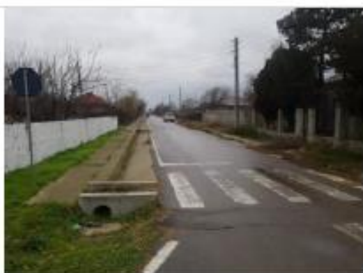
Str. Stefan Voievod