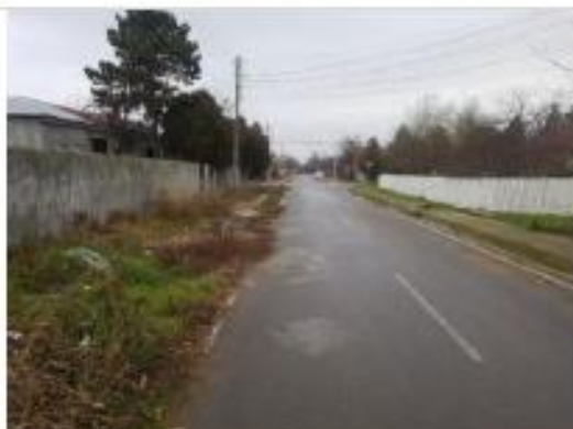
Str. Stefan Voievod