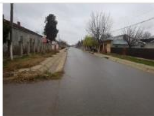
Str. General Dragalina