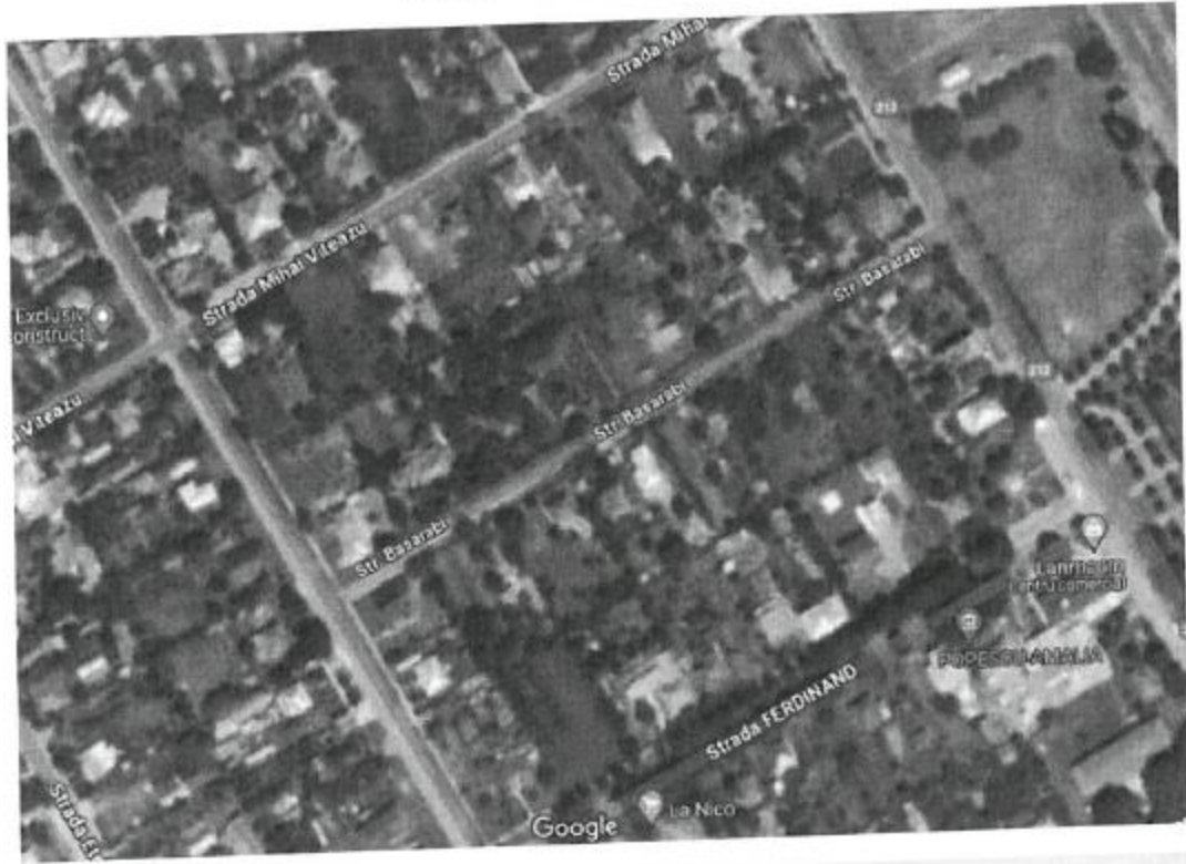
Anexa 4 - Harta Localizare